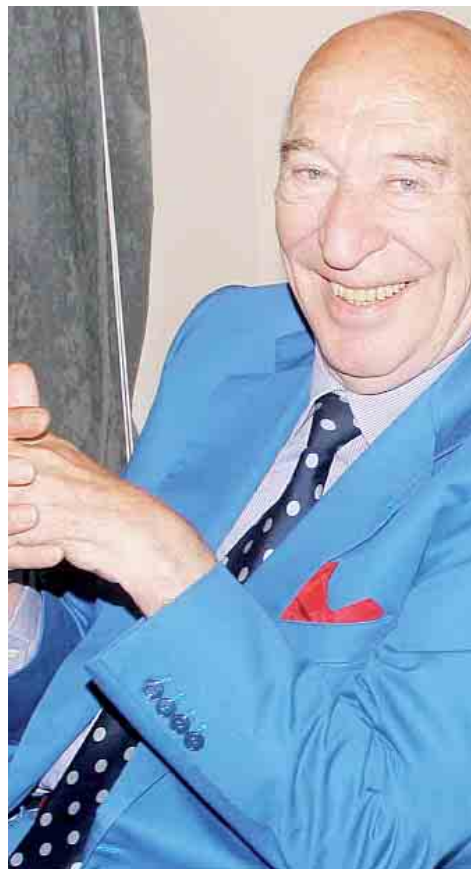
Giuliano Montaldo, il regista genovese di "L'oro di Cuba"

«Ha creato tensioni e sofferenza, però ci sono università, ospedali,