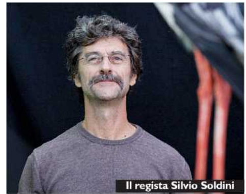
Il regista Silvio Soldini