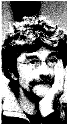
IL REGISTA Silvio Soldini torna alla commedia come in «Pane e Tulipani»

intrecciano spicca quella di Leo (Mastandrea), un idraulico con due figli da crescere, e Diana (Rohrwacher), un'artista piena di idee e senza un soldo. I due si incontreranno nello studio di un avvocato truffaldino, Malaffano (Zingaretti), e si innamoreranno. Ai loro destini si mescolano quelli di Elia, un ragazzino amico di una cicogna, Amanzio (Battiston), che vive da eremita metropolitano, e Teresa (Gerini), la moglie defunta di Leo che lo visita ogni notte.