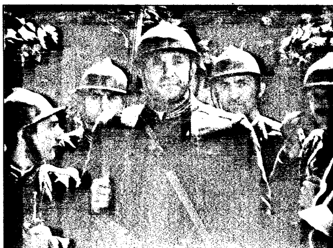
FICTION Flavio Insinna, protagonista di “Eroi per caso”

Altri ci sono tornati malconci, altri ancora sono riusciti a sopravvivere solo grazie alle gesta eroiche di persone “normali” che, rischiando la propria vita, hanno saputo reagire alle difficoltà, anche estreme, con coraggio e grande umanità. Sono gli uomini valorosi che il destino ha mandato al momento giusto, nel luogo giusto: sono gli “Eroi per caso”. Un fotografo di guerra, Cesare, e un cappellano, Don Silvano, vengono incaricati di scortare in trincea un giovane, Vanin, condannato per aver simulato di essere un telegrafista traduttore. La pena, vista la gravità del reato, equivale in pratica alla morte. Per questo motivo, Vanin, appena può, riesce ad eludere la sorveglianza dei due e si dà alla fuga. Il fotografo e il prete, a cui si è unita Teresa, una giovane debole di mente e invaghita del sacerdote, sono disperati. Se non ritrovano il prigioniero, verranno condannati alla sua stessa pena. Inizia così una ricerca affannosa, nel continuo timore di essere scoperti, attraverso i reparti italiani di prima linea.