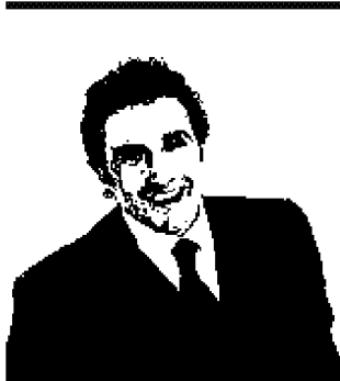
Eredità importante Flavio Insinna

D opo tanti anni in Rai, il passaggio a Mediaset per condurre la «Corrida», da sabato su Canale 5, per Flavio Insinna non è un tradimento: «Farò la Corrida, spero fino in fondo - scherza il conduttore all'Ansa -. Quando sarà finita, ci sediamo e, o ci salutiamo, oppure valutiamo. Loro vogliono continuare a collaborare. Io, per scaramanzia, dico "facciamo un passo per volta e alla fine tiriamo le somme"». Da parte di Mediaset, spiega, «c'è una grandissima apertura e li ringrazio, soprattutto in tempo di crisi non è che tutti ti offrono tutto». Ammette: «E' anche un rischio per me, sarebbe stato più comodo avere 3 o 4 anni di fogli in mano. Ma un artista deve fare un percorso più coraggioso di un impiegato. La paura, l'ansia, sono il mio motore e la mia benzina. Sennò dormirei. E anche se con gli anni impari a gestirla, aumentano le responsabilità e le aspettative, e quindi dormi sempre peggio». La cosa bizzarra è che lunedì e martedì prossimi Raiuno manderà in onda «Eroi per caso» (miniserie sulla prima guerra mondiale che Insinna ha girato nell'estate 2009, ndr). Sarà un caso che la Rai abbia deciso di trasmetterla proprio ora? «Non lo so, voglio sperare di no. Certo, è un po' strano. E non me l'aspettavo. È la prima miniserie del nuovo anno e vorrei fosse